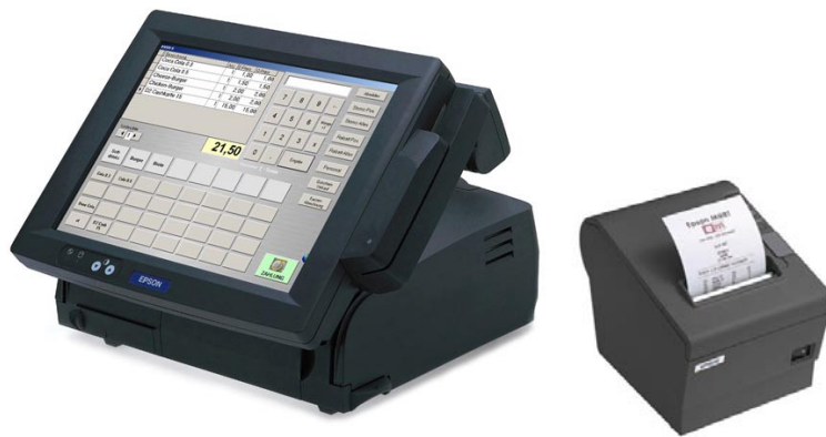
Abbildung zeigt Zusatzausstattung (Kundendisplay + Kartenleser)

Dieses Paket enthält ein komplettes Kassensystem mit PC, Touch-Screen und Bondrucker. Die von Ihnen gewünschte Software-Konfiguration wird vorinstalliert. Das System wird betriebsbereit ausgeliefert. Alle Geräte in schwarz.