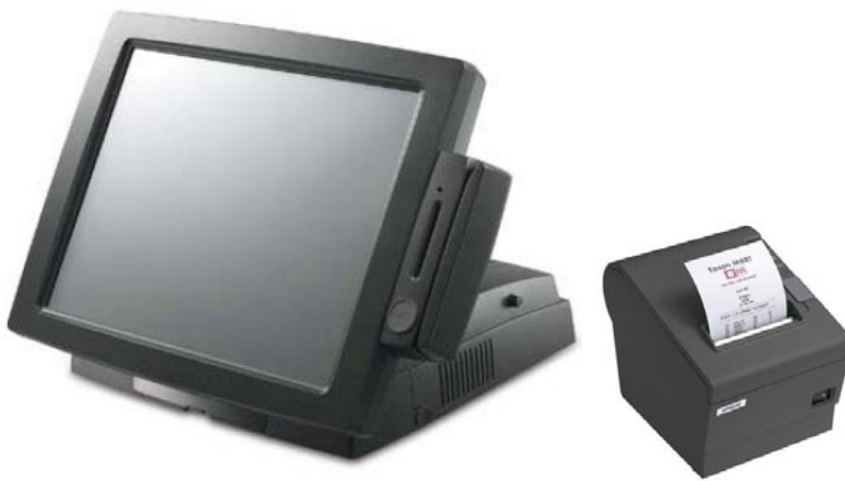
Abbildung zeigt Zusatzausstattung (Kartenleser)

Dieses Paket enthält ein komplettes Kassensystem mit PC, Touch-Screen und Bondrucker. Die von Ihnen gewünschte Software-Konfiguration wird vorinstalliert. Das System wird betriebsbereit ausgeliefert. Alle Geräte in schwarz.